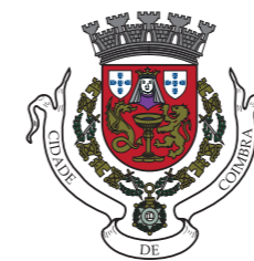
Câmara Municipal de Coimbra